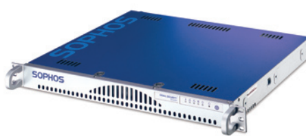
ES5000 (ES8000 è identico) e ES1100: protezione pienamente integrata del gateway e-mail da Sophos